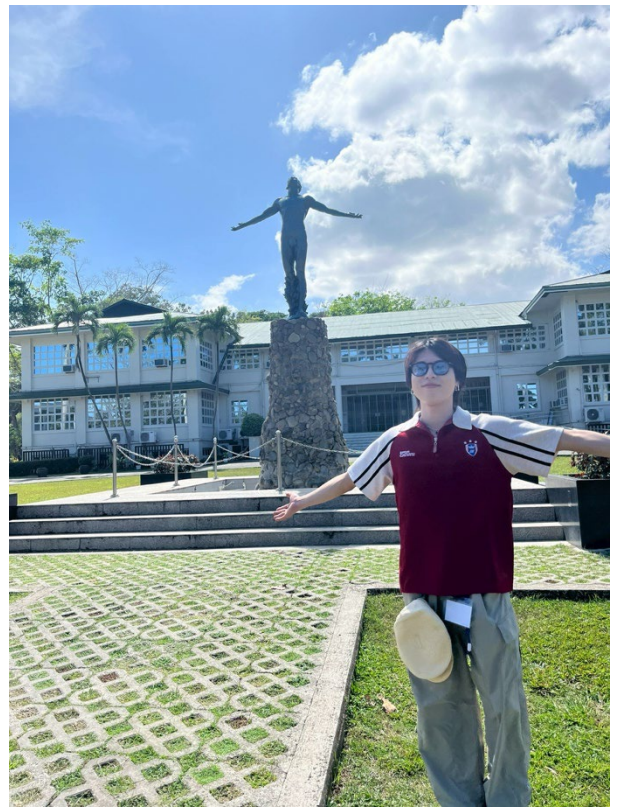
「オペレーション像」と私

きっとその先には、これまでの自分では想像もできなかった新しい自分が待っているはずだからだ。