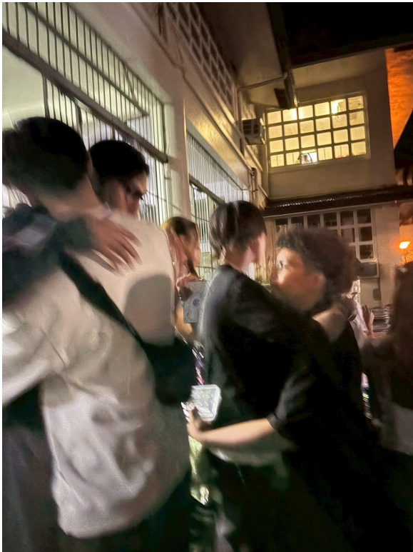
最後のGIで涙を流しながら別れを惜しむ様子

もし少しでも迷っているなら、ぜひ一歩踏み出してみてください。その一歩が、きっとこれからの自分を大きく変えるきっかけになるはずですよ。